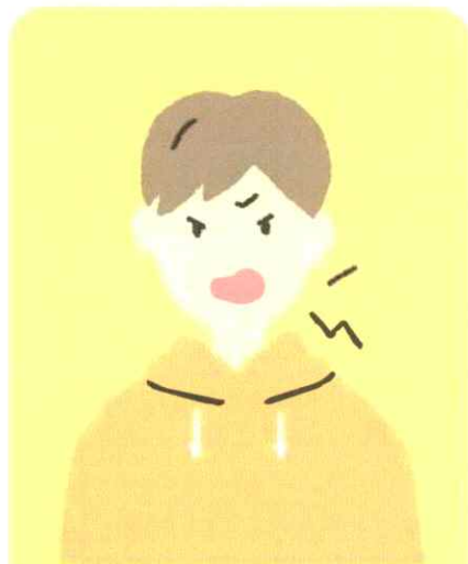
怒りやすくなった